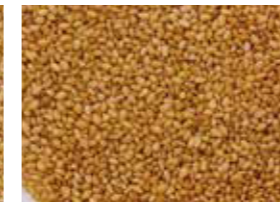
※1 濃口いりごま 白 「いりごま 白」よりやや焙煎が濃い。 間接熱風焙煎(いりごま 白と同じ焙煎 方法)で焙煎。