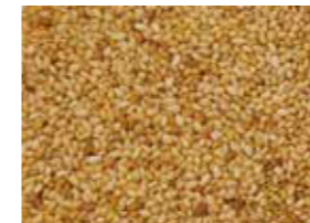
いりごま 白 香り、味ともにバランスのとれた スタンダード品のいりごま。