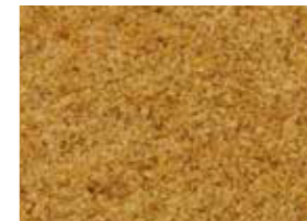
すりごま 白 「いりごま 白」をすりごまにしたもの。