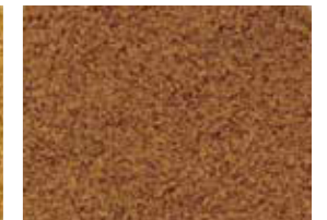
※3 特別濃口すりごま M 白 「特別濃口いりごま 白」をすりごまに したもの。